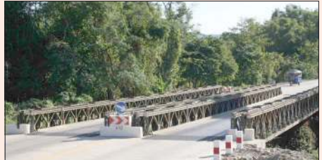
စီပီအိုင်က လူဒါန်းသော ဘေးလိတ်တားကို တွေ့ရစဉ်။