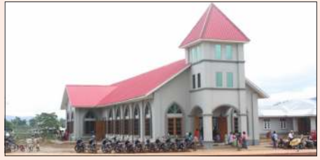
စီပီအိုင်က လူဒါန်းသော ဓရစ်ယာန်ဘုရားကျောင်းကို တွေ့ရစဉ်။