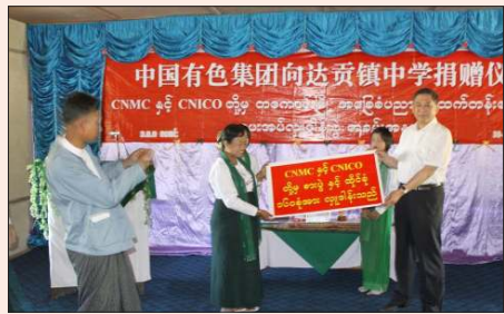
တကောင်းတောင် အလယ်တန်းကျောင်းအတွက် ထိုင်ခုံနှင့် ကုလားထိုင်များကို စီအင်နီအိုင်စီအိုက လှူဒါန်းနေစဉ်။