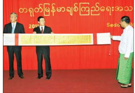
အသစ်ဖွဲ့စည်းထားသော တရုတ်-မြန်မာချစ်ကြည်ရေးအသင်းက လွန်ခဲ့သော ဩဂုတ်လတွင် စည်ပင်လှူဒါန်းပေးခဲ့။