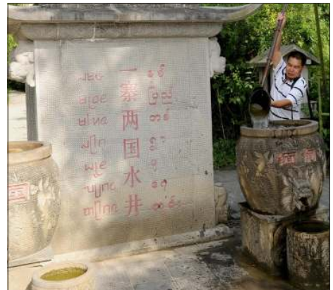
တရုတ်-မြန်မာနယ်စပ်ရှိ ရေတွင်းတစ်တွင်းကို တွေ့ရစဉ်။