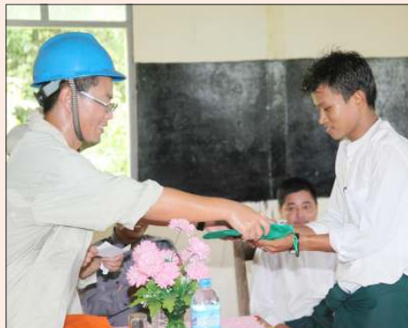
တရုတ်ကုမ္ပဏီဝန်ထမ်းတစ်ဦးက ပညာသင်စရိတ်ထောက်ပံ့နေစဉ်။