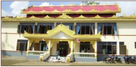
စီပီအိုင်ကုမ္ပဏီက လူဒါန်းသော ဘုန်းတော်ကြီးကျောင်းကို တွေ့ရစဉ်။