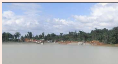
စီအင်နီပီစီ၏ ရေကာတာ။