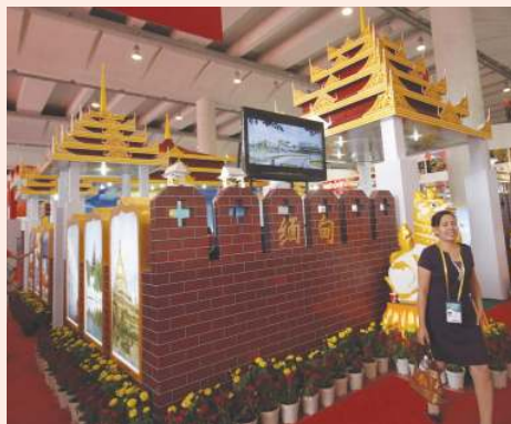
တရုတ်-အာဆီယံပြပွဲတွင် မြန်မာပြခန်းတစ်ခုကို တွေ့ရစဉ်။