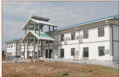
စီအင်နီအိုင်စီအိုက လှူဒါန်းသော ဆေးရုံတစ်ခုကိုတွေ့ရစဉ်။