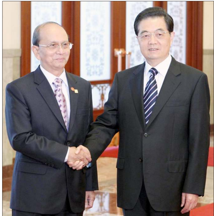
တရုတ်ပြည်သူ့သမ္မတနိုင်ငံသမ္မတ ဟူကျင်ထောင်(ယာ)က ပြည်ထောင်စုသမ္မတမြန်မာနိုင်ငံတော်သမ္မတ ဦးသိန်းစိန်ကို ဝေဟင်မြို့တွင် မေးလွှာကုန်ပို့ရေး အကြံပေးဆက်ဆံရေးစေသည်။ ဇာတ်ပုံ - ရှင်လွှာ

ပထမအနေဖြင့် အခြေခံကျယ်ပြန့်သော အနာဂတ်ကို ဦးတည်ရေးဖြစ်သည်။ ကမ္ဘာ့တစ်ဝန်း globalization အချိန်အဟုန်ဖြင့်လာသည့်အခွင့်အလမ်းများသည် ပိုမိုတစ်ဖက်ဖက် အဖိုးသက်ပြုလာကြသည်။ တည်ငြိမ်သည့် အိမ်နီးချင်းကောင်းစိတ်သည့် ဆက်ဆံရေးကို မကြာခင် အပြန်အလှန်ပေးလှူ