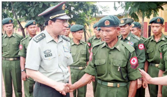
တရုတ်ပြည်သူ့သမ္မတနိုင်ငံ ဗဟိုစစ်ကော်မရှင်ဗိုလ်ချုပ်ကြီး Xu Caihou က မြန်မာစစ်သားတစ်ဦးကို နှုတ်ဆက်နေပုံ။