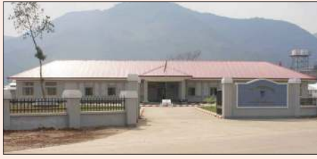
စီပီအိုင်က လူဒါန်းသော ဆေးရုံသစ်ကြီးကို တွေ့ရစဉ်။