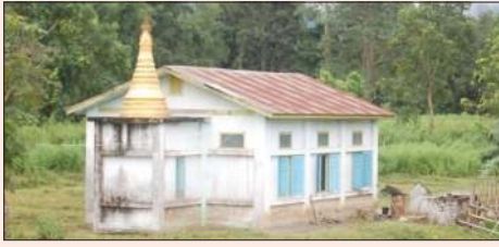
ယခင်ဘုန်းတော်ကြီးကျောင်းအဟောင်းကို တွေ့ရစဉ်။