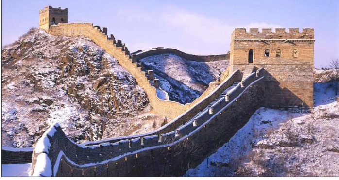
ရှမ်းများလွှမ်းမိုးနေသော မဟာတံတိုင်းကို တွေ့ရစဉ်။