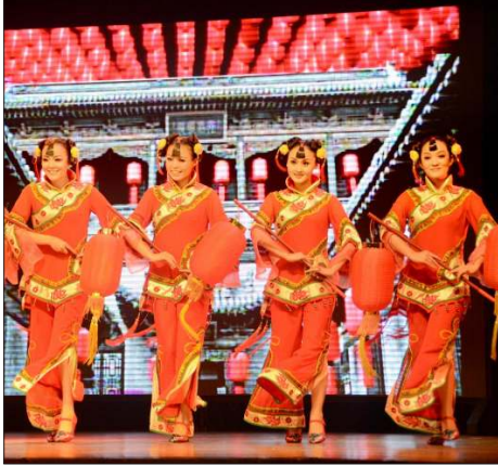
တရုတ်ယဉ်ကျေးမှုအဖွဲ့၏ ဖျော်ဖြေမှုကို MRTV-4 က လွှင့်ထုတ်နေစဉ်။