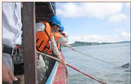
ကျောက်မြို့အနီးတွင် စီအင်နီပီစီက ပင်လယ်ပြင်ကားကွယ်ရေး လုပ်ငန်းများ ဆောင်ရွက်နေစဉ်။

တွင်လည်း တရုတ်နိုင်ငံသည် နောက်ထပ်တစ်ဖန် အမေရိကန်ဒေါ်လာ ၅၀၀,၀၀၀ ကို ငွေသားအသွင်ဖြင့် လှည်းကောင်း၊ အမေရိကန်ဒေါ်လာ ၅၀၀,၀၀၀ တန် ဆေးဝါးများဖြင့် လှည်းကောင်း အရေးပေါ် လူသားချင်းစာနာမှု အကူအညီများ ပေးကမ်းခဲ့သည်။ ပြီးခဲ့သော ငါးနှစ်တာကာလအတွင်းက လူသားအရင်းအမြစ်ဆိုင်ရာ ပူးပေါင်းဆောင်ရွက်မှုကို အပြန်အလှန် အဆက်မပြတ် အားဖြည့်လုပ်ဆောင်ခဲ့သည်။ မြန်မာဝန်ထမ်းနှင့် စက်မှုပညာရှင်ပေါင်း ၁,၀၀၀ ကျော်အား လုပ်ငန်းကဏ္ဍပေါင်း ၂၀ ကျော်တွင် ပါဝင်သောလုပ်ငန်းများနှင့် ဆက်စပ်မှုရှိသော သင်တန်းများ တက်ရောက်နိုင်ရန် ကူညီခဲ့သည်။ အသေးစိတ်အခြေည့်အနုသီလုံပါက http://mm.mofcom.gov.cn