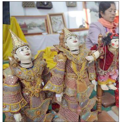
မြန်မာ-တရုတ်နယ်စပ်ကုန်စည်ပြပွဲတွင် မြန်မာရုပ်သေးရုပ်များကို ပြသထားစဉ်။