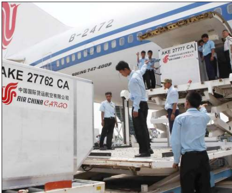
မြန်မာလျှင်ဘေးသင့်ဒေသသို့ ဥက္ကဋ္ဌ Jia က အထူးလေယာဉ်ဖြင့် ဆေးဝါးများ လာရောက်လှူဒါန်းစဉ်။