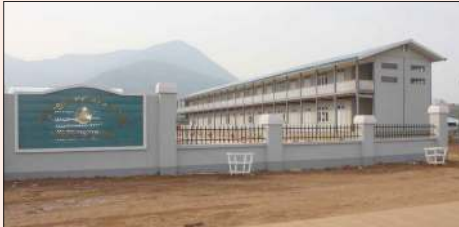
စီပီအိုင်ကုမ္ပဏီက လူဒါန်းသော အထက်တန်းကျောင်းကို တွေ့ရစဉ်။