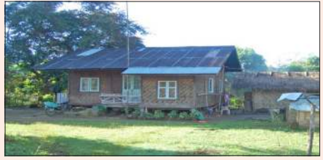
ဓရစ်ယာန်ဘုန်းတော်ကြီးကျောင်းအဟောင်းကို တွေ့ရစဉ်။