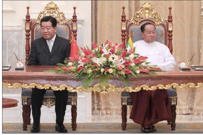
တရုတ်ပြည်သူ့သမ္မတနိုင်ငံ အတိုင်ပင်ခံကွန်မြူနစ်ဥက္ကဋ္ဌ Jia Qinglin နှင့် ပြည်ထောင်စုသမ္မတမြန်မာနိုင်ငံသို့ အလည်အပတ် လာရောက်ခဲ့သည့် မြန်မာသမ္မတ ဦးတင်အောင်မြင်ဦးတို့ကို ဆေးရုံတစ်ရုံဆောက်လုပ်ရန် နားလည်မှုစာချုပ်လွှာ လက်မှတ်ရေးထိုးပွဲတွင် တွေ့ရစဉ်။

အဆင့်သစ်သို့ မြှင့်တင်နိုင်ခဲ့ပါသည်။ ယခုနှစ် ဒီဇင်ဘာလထဲတွင် စတုတ္ထအကြိမ်မြောက် မဟာမိတ် GMS ထိပ်သီးအစည်းအဝေးကို မြန်မာနိုင်ငံက နေပြည်တော်တွင် အိမ်ရှင်အဖြစ် လက်ခံကျင်းပရန် စီစဉ်ထားသည်။ ဤသို့ မြန်မာက အိမ်ရှင်အဖြစ် လက်ခံကျင်းပခြင်းကို တရုတ်အစိုးရက အထူးအရေးထားပြီး ထောက်ခံသည်။ ဤအစည်းအဝေးတွင် တရုတ်ခေါင်းဆောင်များ ပါဝင်လာခြင်းကြောင့် တရုတ်နိုင်ငံ မြန်မာသမ္မတ အခြား GMS နိုင်ငံများအနေဖြင့် လက်ရှိ အကျိုးတူပူးပေါင်းဆောင်ရွက်မှု ပိုမို နက်ရှိုင်းလာမည်ဖြစ်သည်။ တရုတ်-မြန်မာဆက်ဆံရေးများကို သိလိုပါက ဆောက်ပါဝက်ဒ်ဆိုဒ်ကြည့်ပါရန် http://mm.china-embassy.org