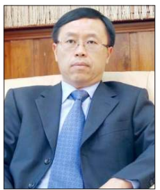
တရုတ်ပြည်သူ့သမ္မတနိုင်ငံ သံအမတ်ကြီး မစ္စတာလီကျွင်းရာ

၁၂ ကြိမ်မြောက်ဖွံ့ဖြိုးရေး ငါးနှစ်စီမံကိန်းအရ လာမည့် ငါးနှစ်တွင် တရုတ်နိုင်ငံသည် သိပ္ပံပညာတိုးတက်မှုနှင့် ကုန်ထုတ်လုပ်မှုတန်ဖိုးသည် အမေရိကန်ဒေါ်လာ ၅ ဒသမ ၈၈ ထရီလီယံရှိရမည်ဟု ဝန်ထမ်းချမှတ်ခဲ့ပါသည်။