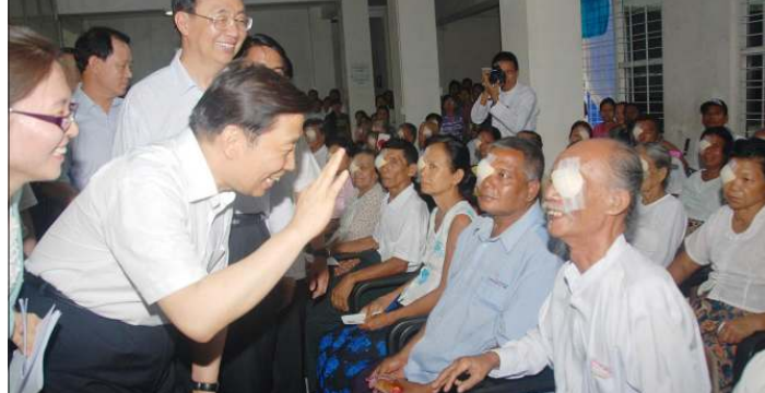
တရုတ်ကွန်မြူနစ်ပါတီ ဗဟိုကော်မတီနိုင်ငံရေးဗျူရိုအဖွဲ့ဝင် Li Yuan chao က တရုတ်ခွဲစိတ်ဆရာဝန်ကြီးများ ကုသပေးသော မျက်စိဝေဒနာရှင်တစ်ဦးကို နှုတ်ဆက်နေပုံ။