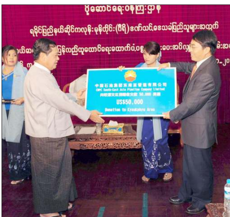
တရုတ်ကုမ္ပဏီက မုန့်တိုင်းဒေသသို့ ကျောက်ဖြူဒေသအတွက် လာရောက်လှူဒါန်းစဉ်။