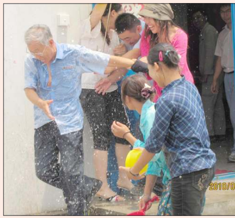
သက္ကံကာလအတွင်း မြန်မာနှင့် တရုတ်နိုင်ငံသားများ အတူရောကစားနေစဉ်။