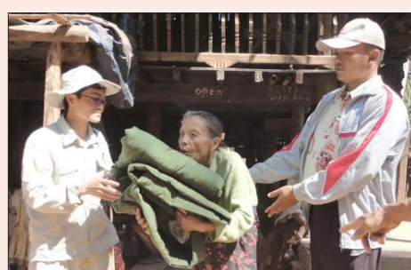
အဘွားအိုတစ်ဦးအား လိုအပ်သည့်ပစ္စည်းများ ကူညီပံ့ပိုးနေစဉ်။