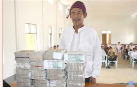
ကျေးရွာသားများအတွက်လည်း ငွေများလှူဒါန်းစဉ်။