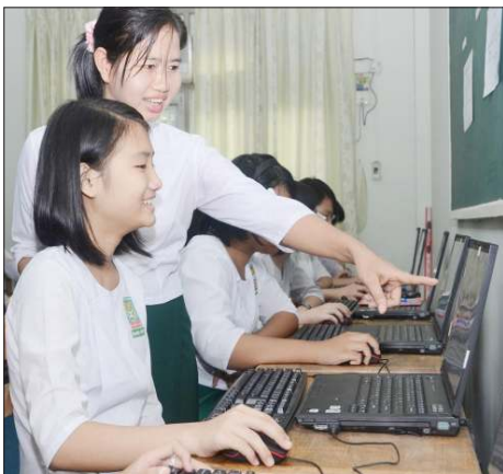
တရုတ်နိုင်ငံမှ လှူဒါန်းသော ကွန်ပျူတာများဖြင့် ရန်ကုန် အမှတ်(၁)အထက ကျောင်းမှ ကျောင်းသူများ အင်တာနက်အသုံးပြုနေစဉ်။