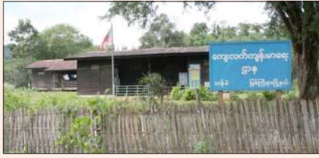
မြစ်ကြီးနားမြို့နယ်၊ တနစ် ကျေးလက်ကျန်းမာရေးဌာနကို တွေ့ရစဉ်။