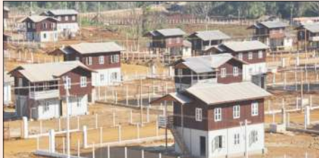
ယနေ့အောင်မြင်သောကျေးရွာကို တွေ့ရစဉ်။