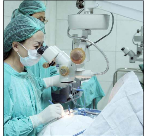
တရုတ်ဆရာဝန်များက မကြာသေးမီက ပြုလုပ်သည့် Brightness Action ခရီးစဉ်တွင် လူနာများကို မျက်စိအခမဲ့ ခွဲစိတ်ကုသပေးနေစဉ်။

၂၀၁၁ ခုနှစ်၊ ဩဂုတ်လ ၂၂ ရက်က တရုတ်-မြန်မာ ချစ်ကြည်ရေးအသင်း ဥက္ကဋ္ဌ ဖစ္စတာ ဝန်ရီက ဦးဆောင်တဲ့ ချစ်ကြည်ရေးအဖွဲ့ မြန်မာနိုင်ငံကို လာရောက်ခဲ့ကြတယ်။ အဲဒီဥပုဒ်က တရုတ်-မြန်မာချစ်ကြည်ရေးအသင်းက ဆီဖိုးနားတိုက်မှာ စည်ပင်လှူဒါန်းပေးခဲ့ရာမှာ စီးပွားရေးလုပ်ငန်း၊ မီဒီယာအစရှိတဲ့ ပုဂ္ဂိုလ် ၂၀၀ ကျော်တို့ တက်ရောက်ခဲ့ကြတယ်။ ၂၀၁၁ ခုနှစ်၊ စက်တင်ဘာလ ၁၁ ရက်က All-China Federation of Returned Oversea Chinese က စေလွှတ်လိုက်တဲ့ အနုပညာသင်အဖွဲ့ဟာ အမျိုးသား ကဏ္ဍတို့မှာ ဖျော်ဖြေခဲ့ပါတယ်။ မြန်မာပရိတ်သတ် ၁,၅၀၀ ကျော် ဖျော်ဖြေမှုကို ကြည့်ရှုခဲ့တယ်။ ■