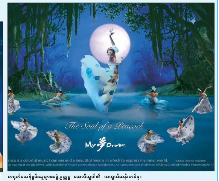
တရုတ်မသန်စွမ်းသူများအဖွဲ့ ၂၂ ဦး ထေလီသူဝါ၏ ကကွက်တစ်ခု။