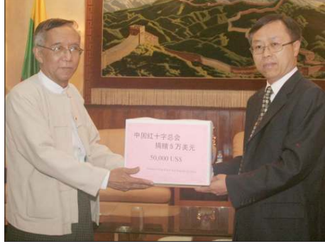
လျှင်ဘေးသင့်ဒေသသို့ တရုတ်ကြက်ခြေနီအသင်းကိုယ်စား သံအမတ်ကြီး လီကျင်းဝှာက လှူဒါန်းနေစဉ်။