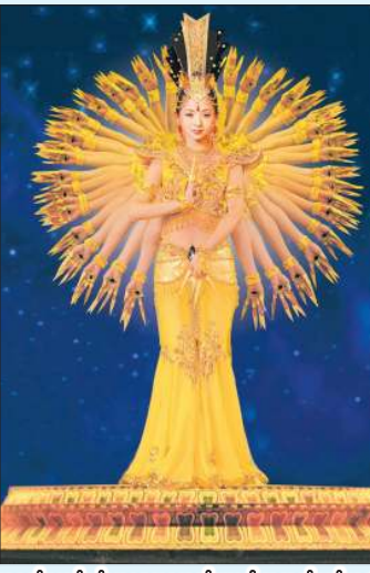
တရုတ်မသန်စွမ်းအနုပညာသည့်များ၏ ကကွက်တစ်ကွက်။

နာမည်ကြီး တရုတ်ဘဲလေးအက အဖွဲ့တစ်ဖွဲ့ဖြစ်သော Chinese Disabled People's Performing Art Troupe အဖွဲ့သည် ၂၀၁၁ နိုဝင်ဘာလ ၃ ရက်နှင့် ၄ ရက်များတွင် ရန်ကုန်မြို့ အမျိုးသားကဏ္ဍတစ်ခု ရန်ပုံငွေပွဲ တစ်ပွဲ ကပြဖော်ပြခြင်းမည်ဖြစ်သည်။ ယင်းဖော်ပြပွဲမှ ရရှိသောငွေများအား ရန်ကုန်ရှိ မိသားစုစွမ်းသုများအတွက် သို့လှူဒါန်းမည် ဖြစ်သည်။ အဆိုပါ ဘဲလေးအကအဖွဲ့မှာ ထင်ရှားသည့် အကအဖွဲ့ဖြစ်ပြီး နိုင်ငံပေါင်း ၇၁ နိုင်ငံတွင်ဖော်ပြခဲ့ရသည်။ ၎င်းအဖွဲ့အား "အလှတရား၏ တမန်တော်" သို့မဟုတ် "ကမ္ဘာ့မသန်စွမ်းသူများအတွက် သံတမန်" ဟု ခေါ်ဆိုကြပြီး "တူလသမဂ္ဂပညာရေး သိပ္ပံနှင့် ယဉ်ကျေးမှုအဖွဲ့ (ယူနက်စကို) မှ ချစ်ကြည်မှုအနုပညာရပ် အဖြစ်ခန့်အပ်ခြင်းခံရသည့် အဖွဲ့လည်းဖြစ်သည်။ ကိုယ်အင်္ဂါမသန်စွမ်းသော အနုပညာရှင်များ၏ကျော့ရှင်းသပ်ရပ်ပြီး အရောင်အသွေး စုံလင်သော ချစ်စဖွယ် ကကွက်များကို ရှုမြင်ရမည်ဖြစ်သည်။ လက်မှတ်များ ကန့်သတ်ထားပါသဖြင့် အောက်တိုဘာလဆန်းမှစ၍ စီးတီးဓိတဝါမတ်ကန်များတွင် စုံစမ်းမေးမြန်းနိုင်ပါသည်။ ■