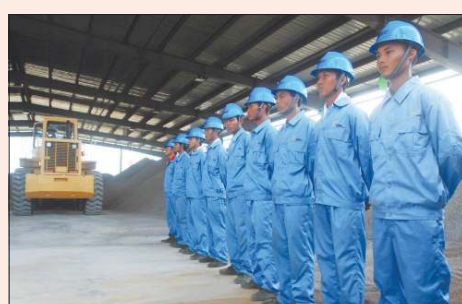
ဒေသခံများအတွက် ဝန်ရိုက်စာမောင်းသင်တန်း ပို့ချနေစဉ်။